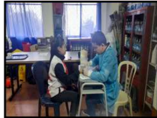
FERIA DE LA SALUD INSTITUCIONES EDUCATIVAS ZONA RURAL