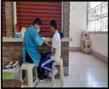
FERIA DE LA SALUD INSTITUCIONES EDUCATIVAS URBANA