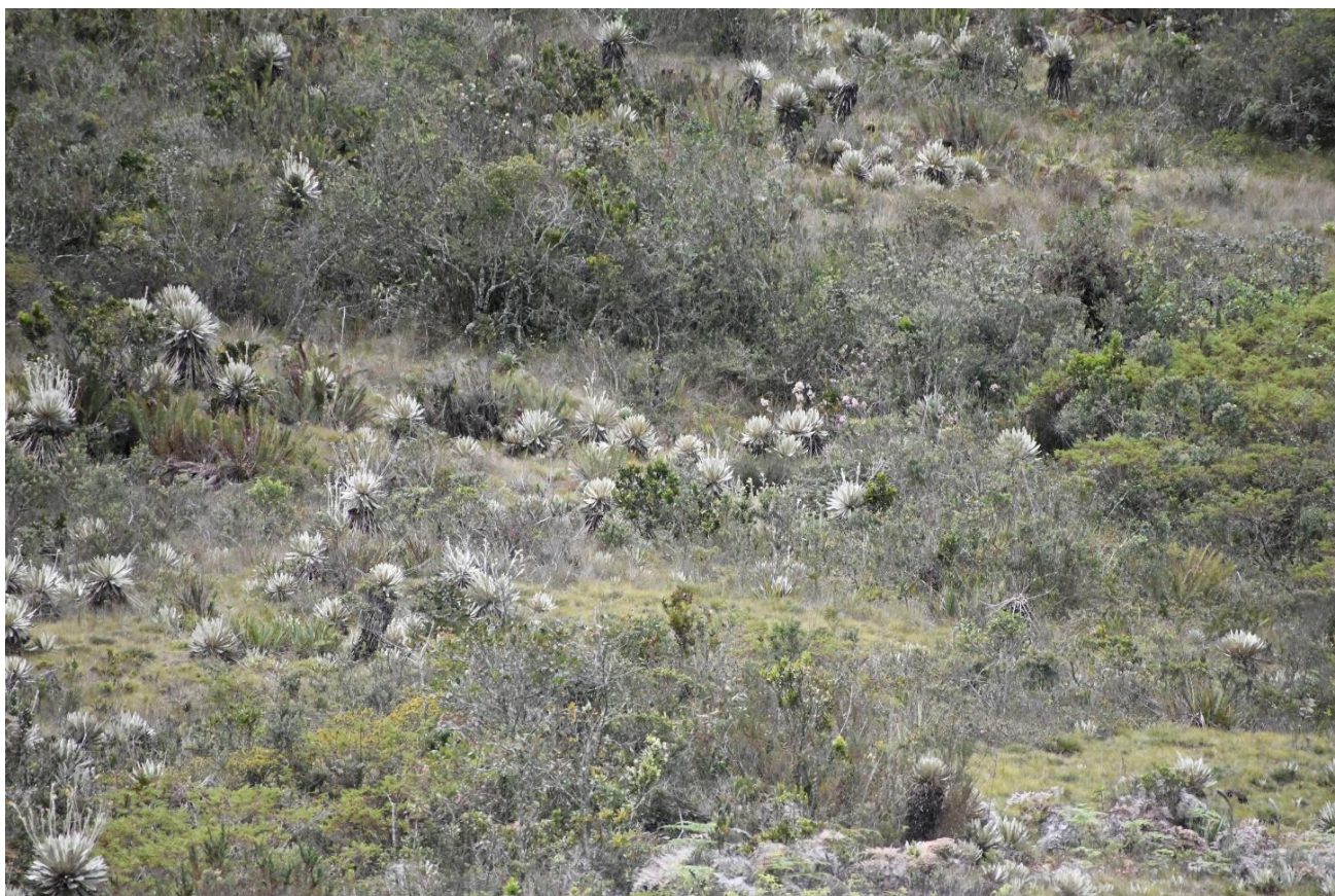
Frailejones en Llanos de Cuivá, reserva custodiada por el Ejército Nacional.